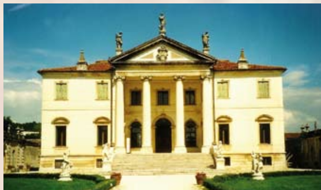
Villa Cordellina Lombardi