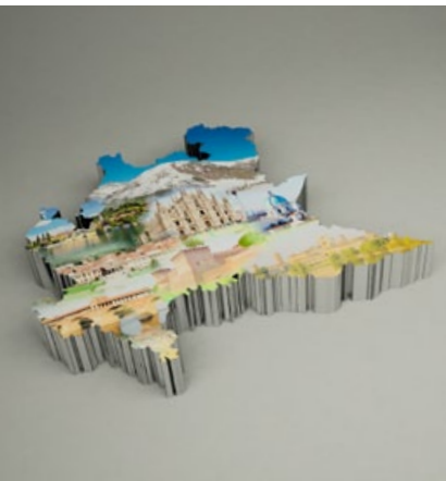
MILANO Torre Unicredit